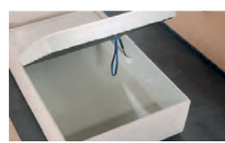
Großraumbettkasten durch aufklappbaren Lattenrahmen