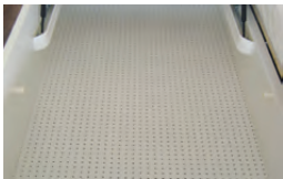
Bodenplatte gelocht für optimale Luftzirkulation