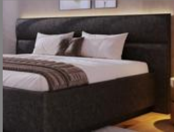
KT TM 20P