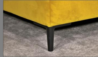
Urban schwarz matt