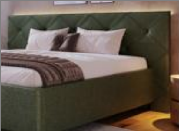
KT TM 21P