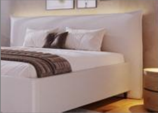
KT TM 19P