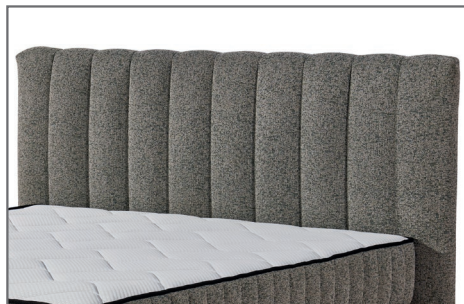
Kopfteil Baldwin B Streifensteppung