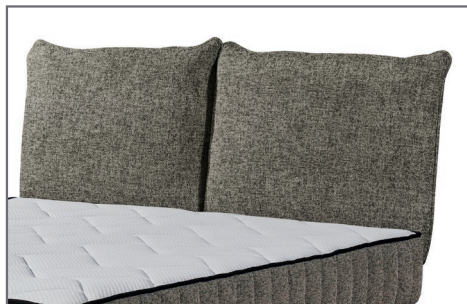
Kopfteil Baldwin A zweigeteilt, Kissenform