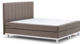
MIT MATRATZE BS01MA / BS02MA