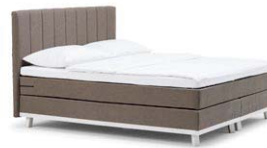
MIT TOPPER TP05