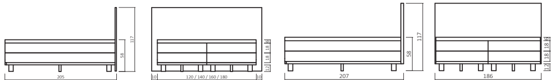
BST2.00 / TRENDI T