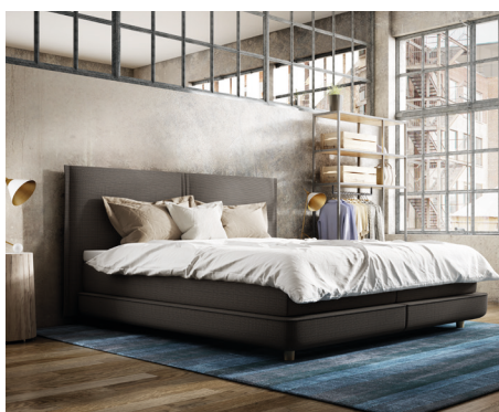
Plattform Box im Milieubild