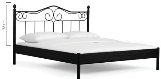
214.03 (ist ab 140 cm lieferbar) PALERMO