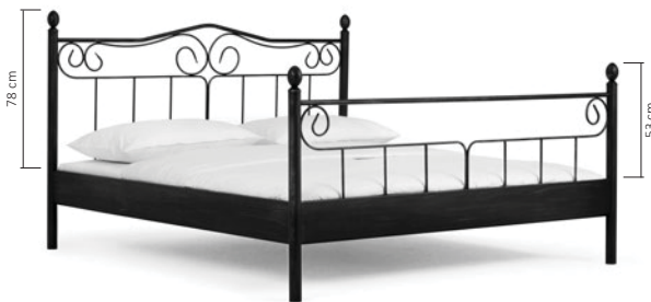
214.00 (ist ab 140 cm lieferbar) ZYPERN