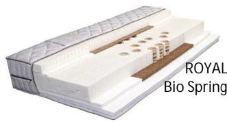
ROYAL Bio Spring

Zwei unterschiedliche Liegeflächen durch wenden.