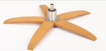
WSK Holzstern Fuß Schwarz