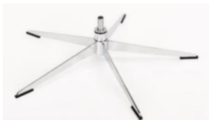
OS Orion Base - Chrom