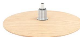
DBS Diskfuß Schwarz