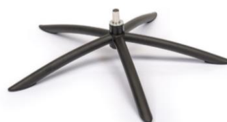
TSS2 Tube Space Metall Schwarz