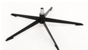
OSS Orion-Base - Schwarz matt