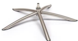
TS Tube Space Metall gebürstet