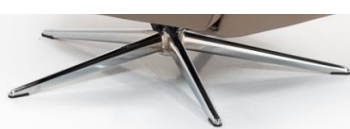
PB Polaris-Base - Chrom