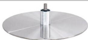
DBB Diskfuß - Metall gebürstet