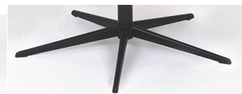
PBS Polaris-Base - Schwarz