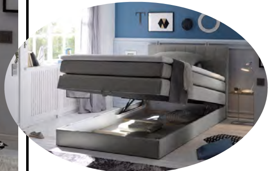
inkl. einem integrierten Bettkasten

Stk. im LKW 80 m 3 43 Anzahl Packungen 4 Logistik Ost DL