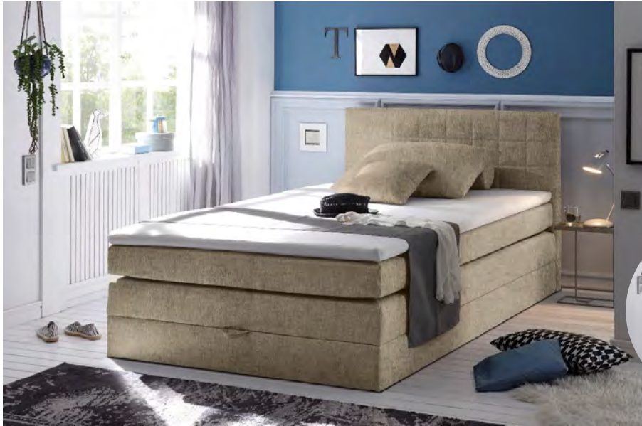
Soro 23 sand

Boxspringbett 140 x 200 cm mit Bettkasten