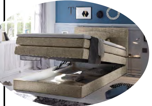
inkl. einem integrierten Bettkasten