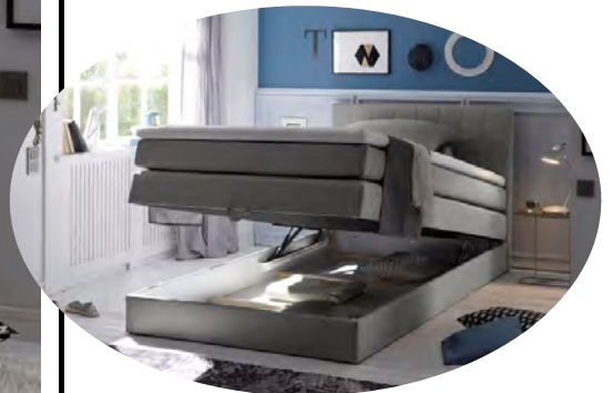
inkl. einem integrierten Bettkasten

Boxspringbett 120 x 200 cm mit Bettkasten