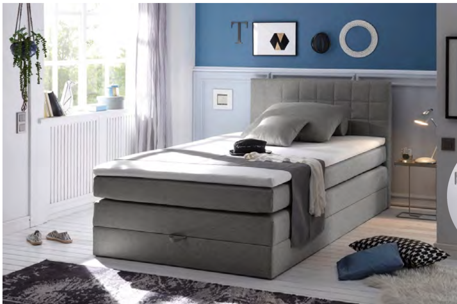
Savanna 21 grau

Boxspringbett 120 x 200 cm mit Bettkasten