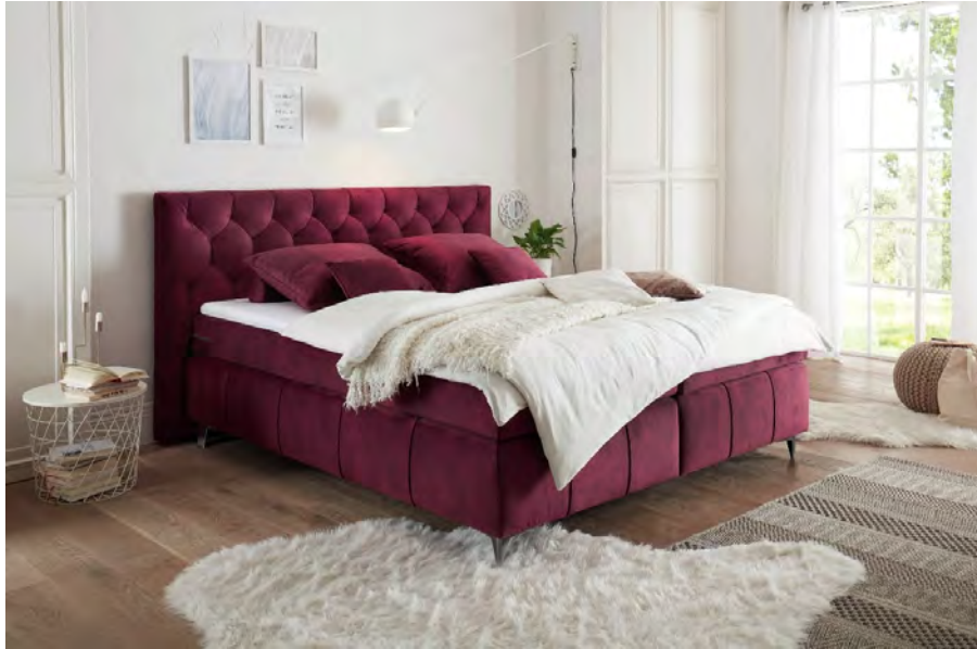
Salvador 06 burgund