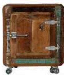
Nachttisch/ night stand 2659-98 19.7"x14.96"Dx22"H 50 x 38 x 56 cm