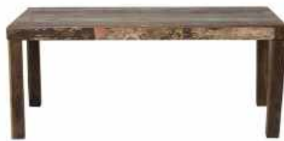
Tische/tables 2614-98: 55.1"Wx35.4"Dx29.9"H / 140 x 90 x 76 cm 2618-98: 70.9"Wx35.4"Dx29.9"H / 180 x 90 x 76 cm