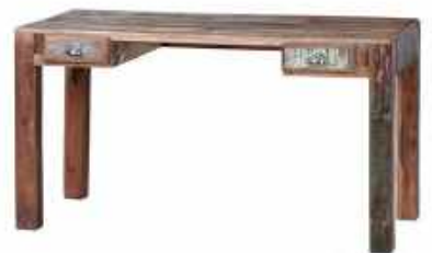
Schreibtisch/desk 2607-98 55.1"Wx23.6"Dx29.9"H 140 x 60 x 76 cm