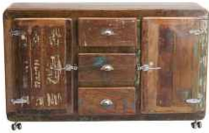
Sideboard 2603-98 59.1"Wx15.7"Dx35.4"H 150 x 40 x 90 cm