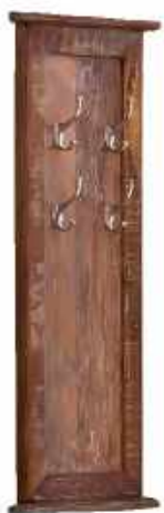
Garderobe/ coat rack 02663-98 13.8"Wx3.1"Dx43.3"H 35 x 8 x 110 cm