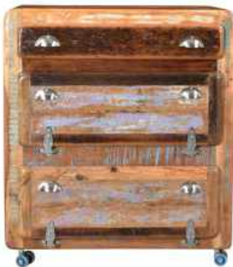
Schuhschrank/ shoe cabinet 02662-98 33.5"Wx15.7"Dx35.4"H 85 x 40 x 90 cm