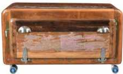
Schuhschrank/ shoe cabinet 02658-98 33.5"Wx15.7"Dx17.7"H 85 x 40 x 45 cm