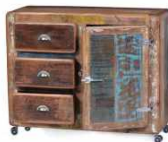
Kommode/chest 2609-98 39.4"Wx15.7"Dx35.4"H 100 x 40 x 90 cm