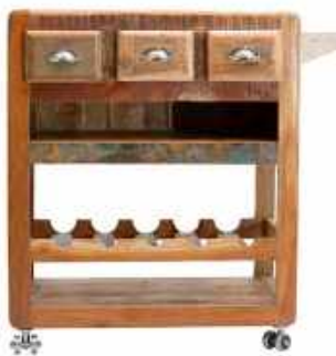
Küchenwagen/ kitchen cart 2687-98 30.7"Wx18.9"Dx 33.5"H 78 x 48 x 85 cm