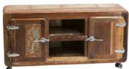
TV-Lowboard 2615-98 53.1"Wx15.7"Dx22"H 135 x 40 x 56 cm