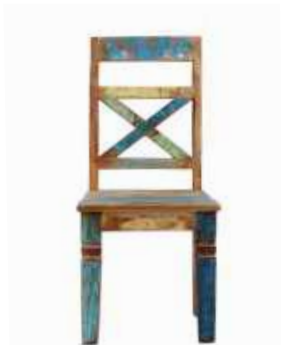
Stuhl/chair 09112-98 17.7"Wx17.7"Dx39.4"H 45 x 45 x 100 cm