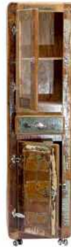
Hochschrank/tall cabinet 2605-98: opens from left 2606-98: opens from right 21.6"Wx14.96"Dx74.8"H 55 x 38 x 190 cm