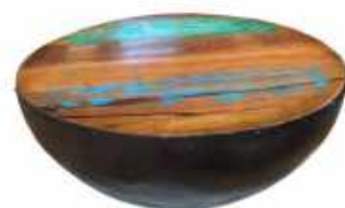
Couchtisch/ coffee table 2680-98 27.6"Wx27.6"Dx13.8"H 70 x 70 x 33 cm