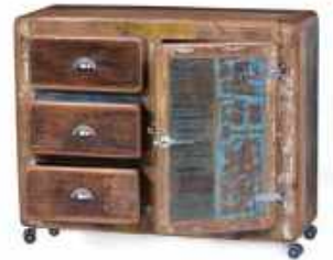
Kommode/chest 2609-98 39.4"Wx15.7"Dx35.4"H 100 x 40 x 90 cm