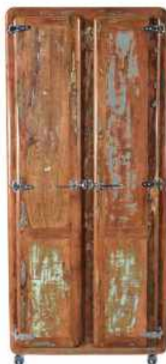
Schrank/cabinet 02664-98 31.5"Wx15.7"Dx70.9"H 80 x 40 x 180 cm