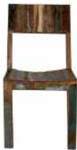
Stuhl/chair 02612-98 15.7"Wx 17.7"Dx39.4"H 44 x 45 x 89 cm