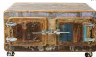
Couchtisch/ coffee table 2694-98 35.4"Wx 35.4"Dx15.7"H 90 x 90 x 40 cm