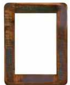
Spiegel/mirror 2690-98 23.6"Wx1.2"Dx31.5"H 60 x 3 x 80 cm