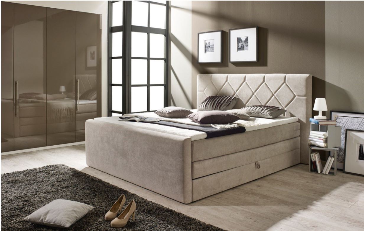
Modell Twin 2