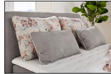
344/19 – 605/05 – 344/19