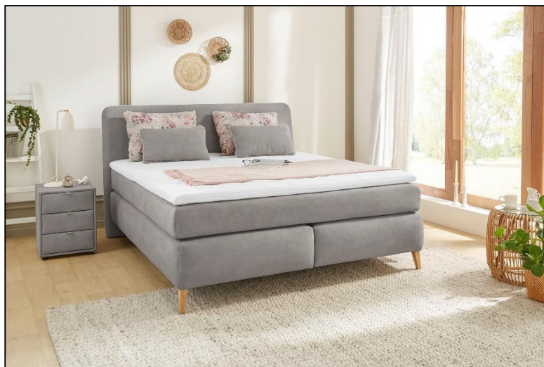
344/19 – 605/05 – 344/19