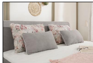
344/19 – 605/05 – 344/19