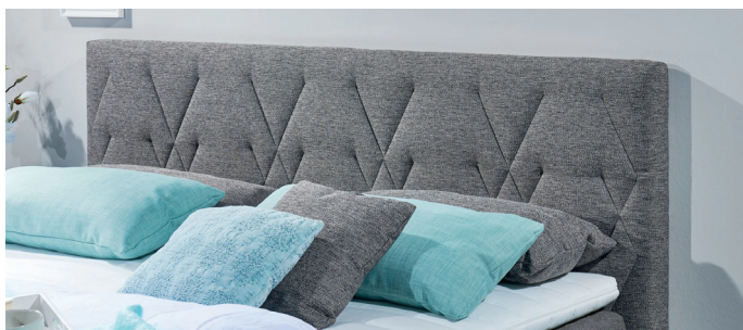
Kopfteil 2, Steppung Geometrie