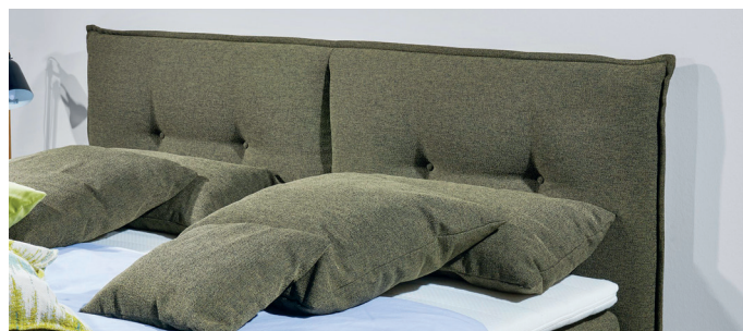
Kopfteil 3, Kissenoptik