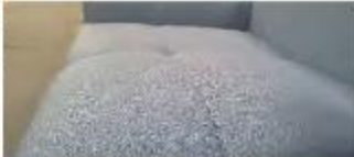
Detail 3: Legere, weiche Optik und Komfort mit modelltypischer Faltenbildung