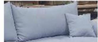
Detail 4: inklusive 2 Rückenkissen + 2 Zierkissen

Gestell: Tragende Teile aus massivem Hartholz, Verbindungen der tragenden Teile verdübelt oder verzapft, Spanplatte, Sperrholz