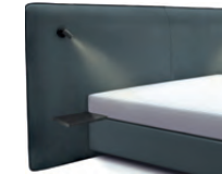
1867 Höhe 129 cm mit 2 Ablagetischen und 2 Lampen schwarz inkl. Keder