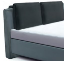
1861 Höhe 90 cm inkl. 2 losen Rückenkissen (Wende/Relax-Kissen) mit Rolle / Höhe 101 cm (nur ab Breite 160 cm möglich)