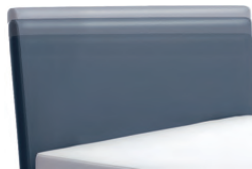
1300 Höhe 55 - 125 cm in 5 cm-Schritten kürzbar