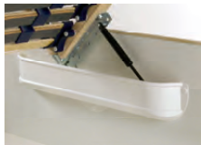
inkl. Luxus-Gasdruckfeder zum Öffnen des Lattenrahmens und Nutzung des Stauraums (nicht in Verbindung mit Motorlattenrahmen)