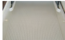
inkl. gelochter Bodenplatte für optimale Luftzirkulation