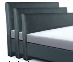
→ 1868S - Höhe 99 cm → 1868M - Höhe 109 cm → 1868L - Höhe 119 cm