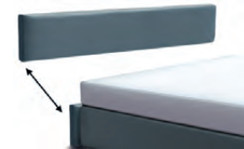
3124 Höhe 24 cm Kopfteil-Blende