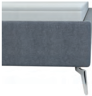
kubisch ohne Sichtholzrahmen Höhe ca. 24 cm