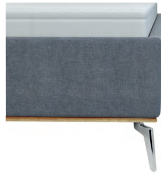
kubisch mit Sichtholzrahmen Wildeiche geölt - nur bei Fußhöhe 16 cm lieferbar - Höhe ca. 26 cm inkl. Sichtholzrahmen