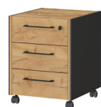
1569-549 B/H/T 42/54/49 cm

Rollcontainer in Graphit/Navarra-Eiche-Nb., Melaminharzbeschichtung, hochwertige ABS-Kanten, Schubladen mit Selbsteinzug, Filigrane Dualkante, Bügelgriffe aus Metall, Abschließbare Schublade, Laufrollen