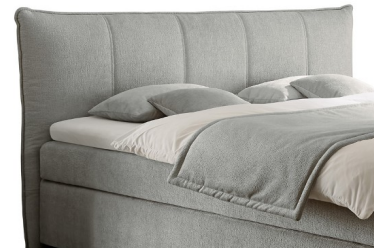
Kopfteil 3 (kürzbar) Stellmaßlänge ca. 210 cm Stellmaßbreite ca. Liegefl. + 20 cm Kopfteilhöhe ca. 111 cm Cremefarbene Doppelziernähte (Kontrastnähte bei dunklen Stoffen)