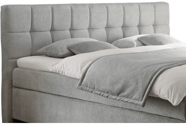
Kopfteil 1 (kürzbar) Stellmaßlänge ca. 210 cm Stellmaßbreite ca. Liegefl. + 11 cm Kopfteilhöhe ca. 111 cm