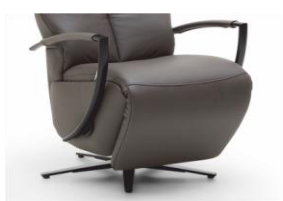
Armteil 3 Chrom/ schwarz matt gegen Aufpreis