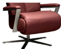
Armteil 4 gegen Aufpreis