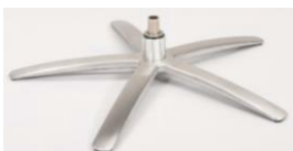
SB Sirius Base - Silver

Für alle Fußvarianten EB/EBS und SB/SBS Gaslift-Höhenverstellungs- Option möglich.