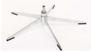
OS Orion Base - Chrom