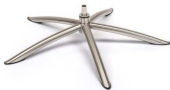
TS Tube Space Metall gebürstet

(Gaslift-Höhenverstellungs-Option nicht möglich)