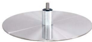
DBB Diskfuß - Metall gebürstet

(Gaslift-Höhenverstellungs-Option nicht möglich)