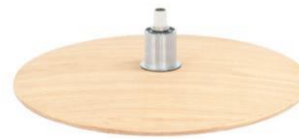
DBU Diskfuß Buche unbehandelt

(Gaslift-Höhenverstellungs-Option nicht möglich)