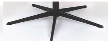
PBS Polaris-Base - Schwarz

(Gaslift-Höhenverstellungs-Option nicht möglich)