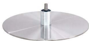
DBB Diskfuß - Metall gebürstet

(Gaslift-Höhenverstellungs-Option nicht möglich)