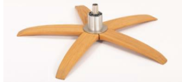
WSK Holzstern Fuß Schwarz