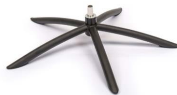
TSS2 Tube Space Metall Schwarz

(Gaslift-Höhenverstellungs-Option nicht möglich)