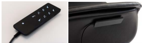
Kabelgebundene Fernbedienung Sessel 4-Motoren + Massage.