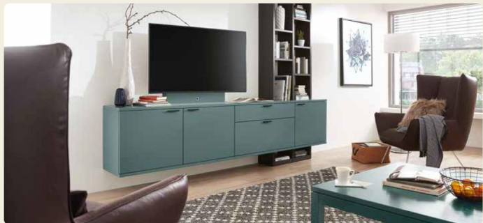
Wohnkombination 40138, B/H/T ca. 270,0/215,7/49,2 cm Couchtisch 90302, B/H/T ca. 120/40,8/75 cm Ausführungen: Lack Ocean, Eiche Graphit