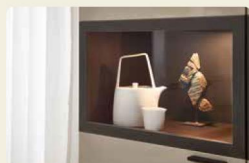
Der Vitrinenrahmen ist in Eiche graphit abgesetzt.

Highboard 40061, B/H/T ca. 180/117,8/39,6 cm Säulentisch 90974, B/H/T ca. 180/77/95,0 cm Vitrine 40135, B/H/T 120/218,3/39,6 cm Stuhl R3 937/44, B/H/T ca. 56/82,5/59,0 cm, SH: 49,3 cm, ST: 43,5 cm Ausführungen: Eiche Graphit, Lack Flatingrau Hochglanz