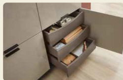
Innenschubkästen schaffen Platz.