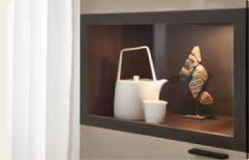
Der Vitrinenrahmen ist in Eiche graphit abgesetzt.