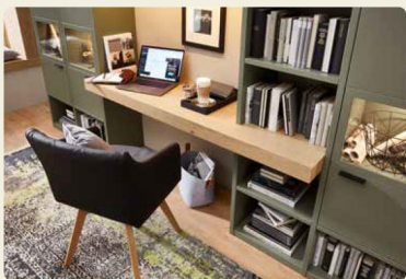
Die integrierte Schreibplatte kann für die private Korrespondenz gut genutzt werden.

Von diesem Platz aus schaut man doch gerne nach draußen und genießt das Leben. MONDO Artist bietet euch jede planerische Freiheit, euer Möbel ganz an eure Räumlichkeiten und eure persönlichen Bedürfnisse anzupassen. Wie hier zum Beispiel eine schöne Kombination aus Bücherregal, Vitrinen und einem kompakten Arbeitsplatz für das Heimbüro in Lack Olivgrau und Asteiche furniert. Alles kann – nichts muss.