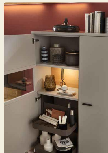
Komfort-Tablarauszug: Mit dem Komfort-Tablarauszug kannst Du wertvollen Stauraum in Sideboard und Schrank nutzen. Die Auszüge kommen auch bei Öffnen der Tür entgegen, so dass ihr bequem von oben hineingreifen und Sachen verstauen können – damit gehören schlecht zugängliche Ecken im Schrank der Vergangenheit an.

Die Lösung aus einem großzügigen Regal und der modernen TV-Wohnkombination bietet einen harmonischen Zweiklang aus der natürlichen Asteiche und dem modernen Lack Grau. So stellt sich eine angenehme Wohlfühlumgebung ein, die durch diverse Komfortfunktionen, wie z. B. den Tablarauszug noch einmal gesteigert wird.