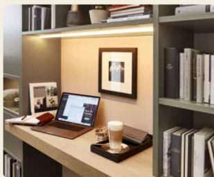
Eine gute Ausleuchtung ist wichtig und schont die Augen.