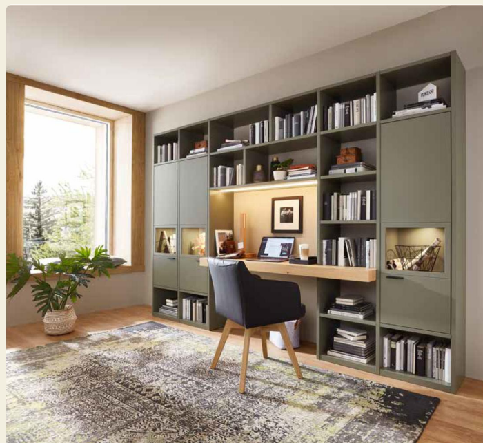
Regalkombination 40745, B/H/T ca. 320,3/215,7/492 cm