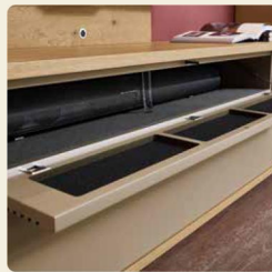
Hinter der praktischen Klappe verschwinden die Geräte.

Ein modernes und leichtes Wohnbild ergibt sich aus den solitär stehenden Einzelementen der Wohnkombination in Lack Cashmere und Asteiche. Der symmetrische Aufbau der Elemente schafft Ruhe und fügt sich harmonisch ins Ambiente ein.