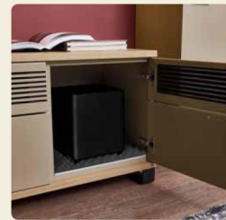
Auch der Subwoofer ist mangoptimiert untergebracht.