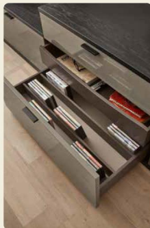
Mit Innenschubkästen schafft ihr Ordnung.