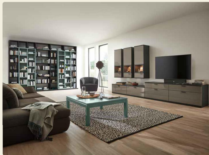
Regalkombination freie Planung, B/H/T ca. 3578/2509/55,2 cm