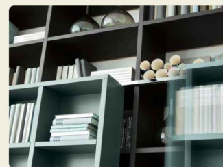
Die Schieberegalen werden oben und unten leichtgängig geführt.