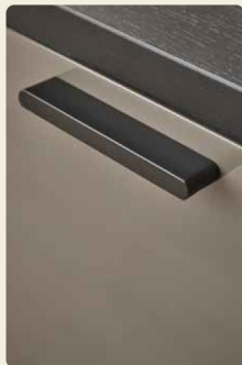
Griffe wahlweise Chrom glänzend, edelstahlfarbig oder wie hier, in Lack Schwarz matt.

Wer neben einer Wohnkombination auch eine Bibliothekslösung mit zwei esstf. laufenden Schieberegalen zu schätzen weiß, findet hier die Erfüllung seiner Träume. Die Schiebeelemente geben je nach Situation und Anforderung unterschiedliche Bereiche Ihrer Bibliothek frei, z. B. Buchrücken oder Accessoires, Magazine oder Bildbände.