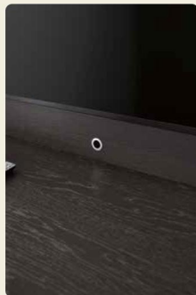
Dank des Funkrepeaters könnt ihr mit der Fernbedienung z. B. den TV-Receiver im Schrankinneren verstauen, das Signal wird in das Möbelinnere weitergeleitet.