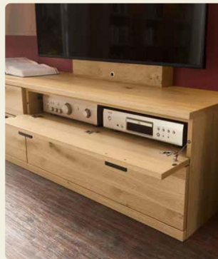
Das Entertainment Equipment verschwindet hinter der Technikklappe

Regalkombination 40704, B/H/T ca. 184,1/280,9/36,0 cm Couchtisch 91031 mit Tischplatte (Klarglas), B/H/T ca. 120/46,1/78 cm Wohnkombination 40603, B/H/T ca. 360,0/218,3/49,2 cm Ausführungen: Asteiche, Lack: Grau