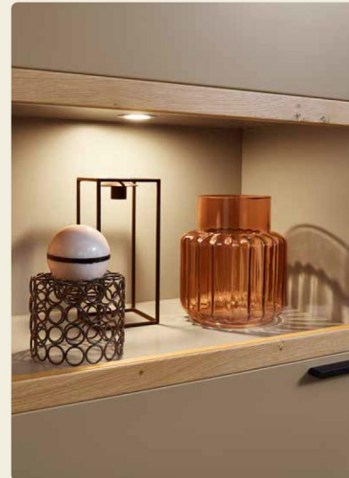
Die Vitrinen sind angenehm beleuchtet.

Wohnkombination 40744, B/H/T ca. 360/0/188,2/49,2 cm Couchtisch 9030, B/H/T 120,0/41,1/75 cm Sideboard mit Kufen 40041, B/H/T ca. 240/100,2/39,6 cm Wandbord 90551, B/H/T ca. 180/17/20 cm Ausführungen: Asteiche: Lack Cashmere