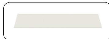
Einlegeböden Breite 45 und 90 cm