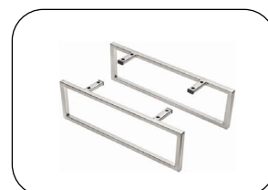
Möbelkufen Schwarz matt und edelstahlfarbig