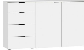
Kommode Typ 16