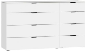
Kommode Typ 13