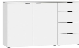
Kommode Typ 18