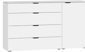
Kommode Typ 14