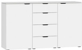
Kommode Typ 17