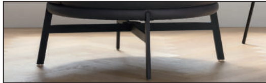
Metallfuß schwarz matt (282), 360° drehbar