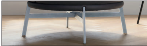
Metallfuß Chrom glänzend (281), 360° drehbar