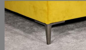
Urban schwarz Chrom