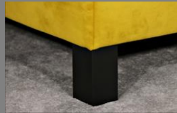
Holz viereckig schwarz