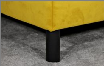
Holz rund schwarz