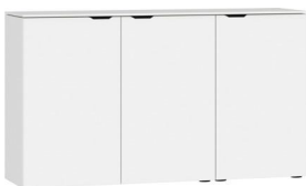
Kommode Typ 19