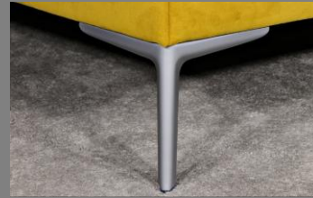
Wing silber matt