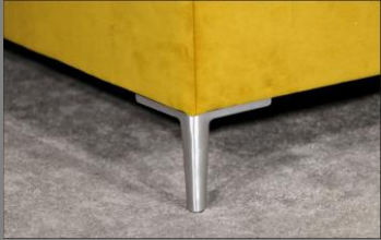
Urban Alu gebürstet