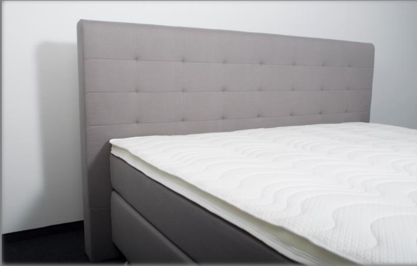
KT TM 1