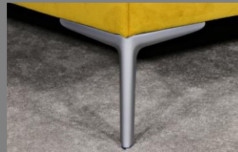
Wing silber matt