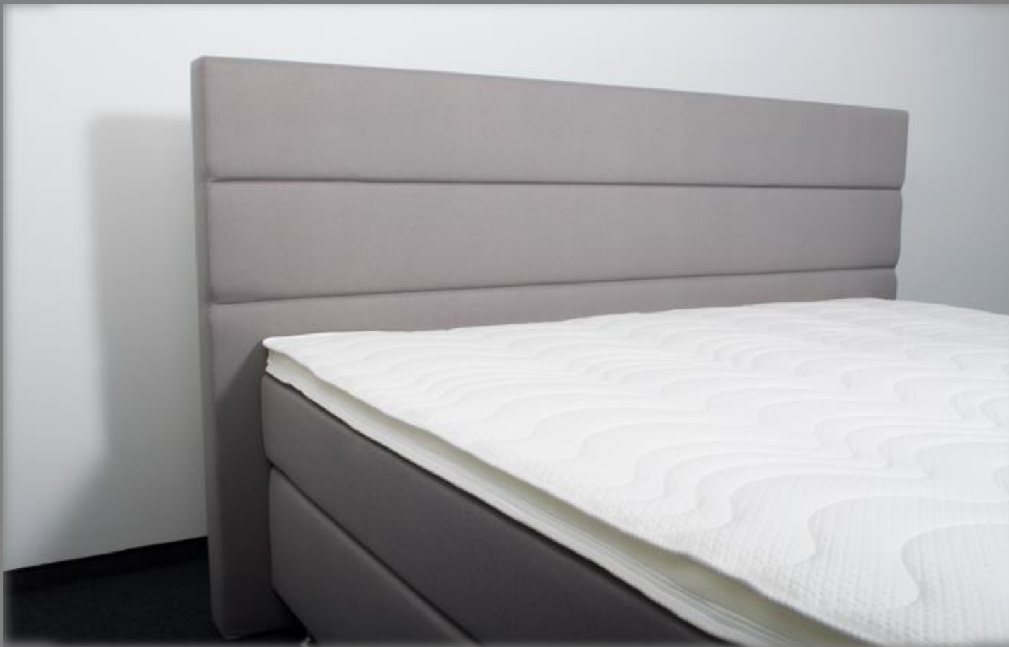
KT TM 3