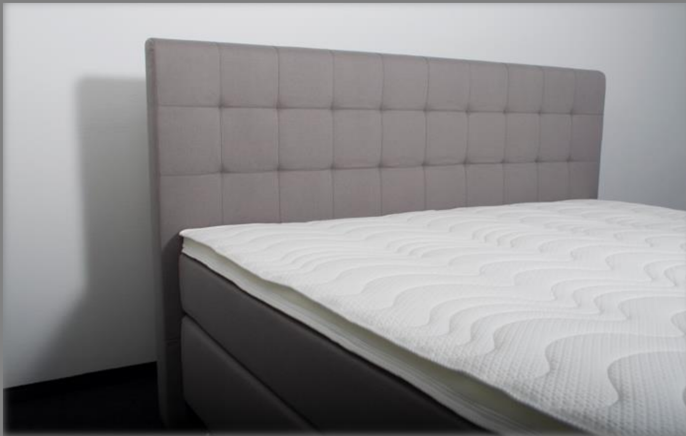
KT Space 3