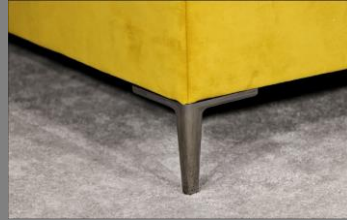
Urban schwarz Chrom