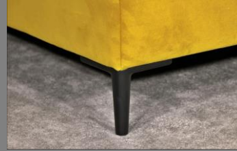
Urban schwarz matt