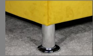
Vitalis Alu rund