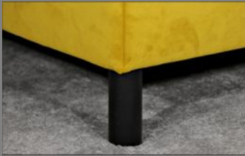
Holz rund schwarz