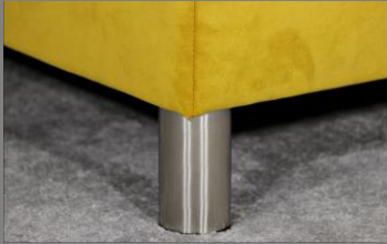
Alu rund poliert