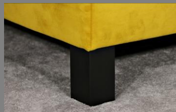
Holz viereckig schwarz