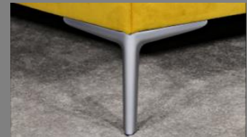
Wing silber matt