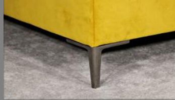
Urban schwarz Chrom