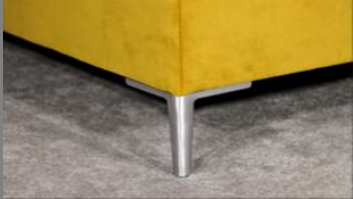
Urban Alu gebürstet