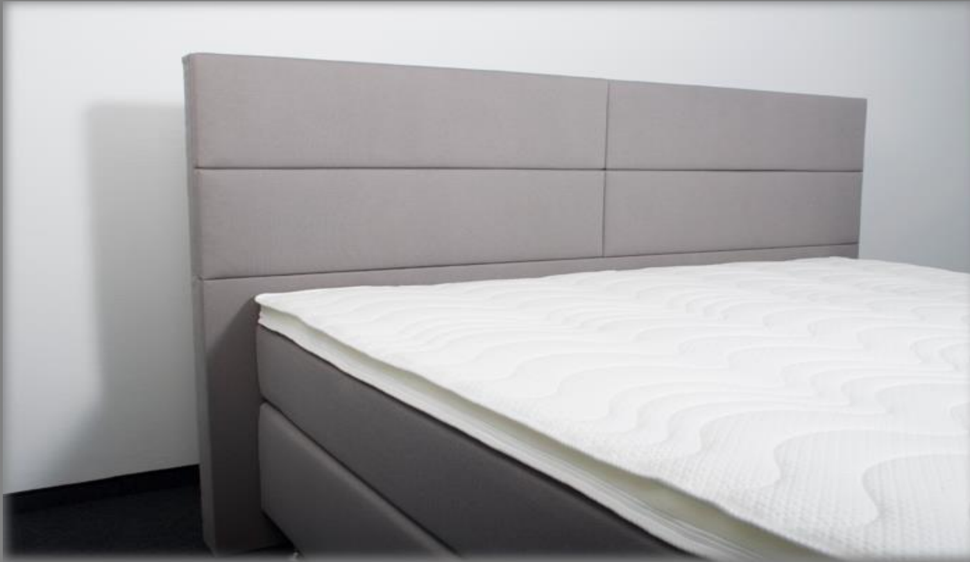
KT Space 1