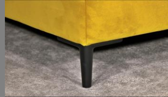
Urban schwarz matt