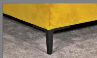
Urban schwarz matt