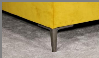
Urban schwarz chrom