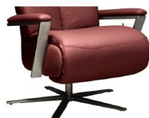
Armteil 4 gegen Aufpreis