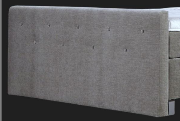
FT Topmotion 12