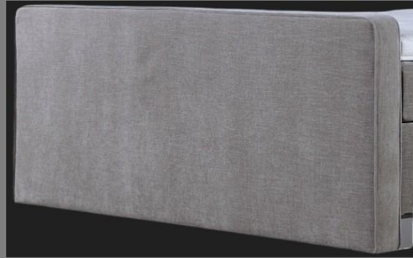
FT Topmotion 2