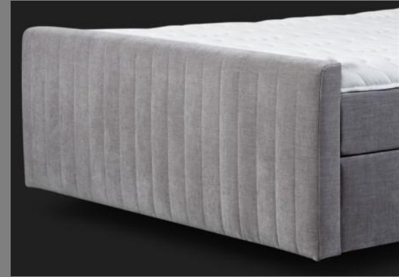
FT Topmotion 14