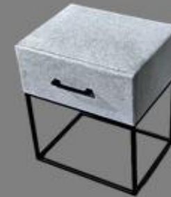
Nchttisch Fame La