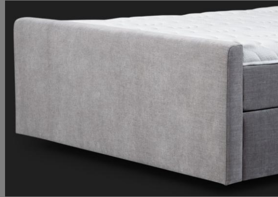
FT Topmotion 13