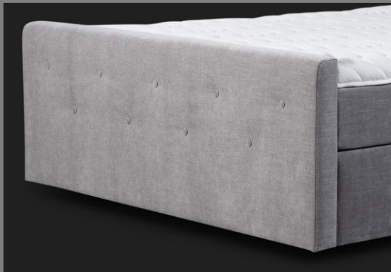
FT Topmotion 15