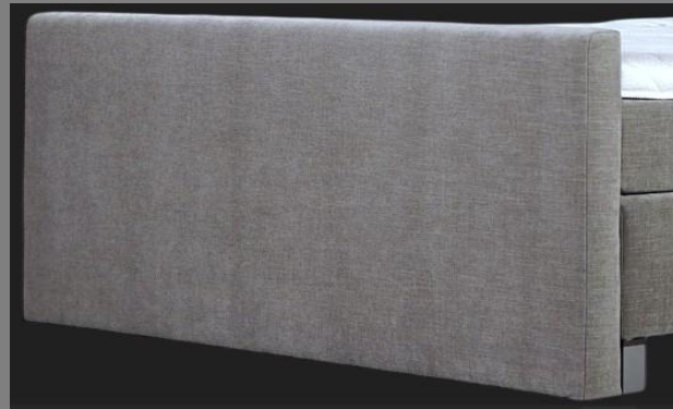
FT Topmotion 10