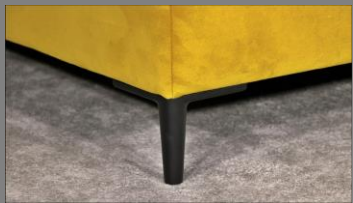
Urban schwarz matt