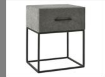
Nachttisch Frame La