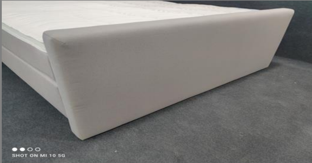
FT Space I