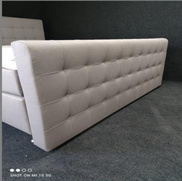
FT Space III