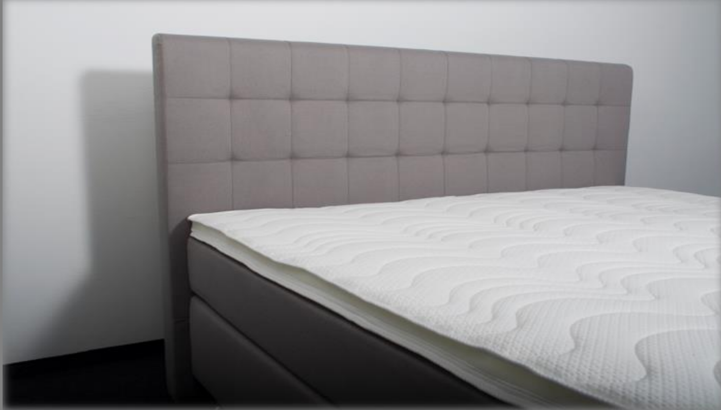
KT Space III