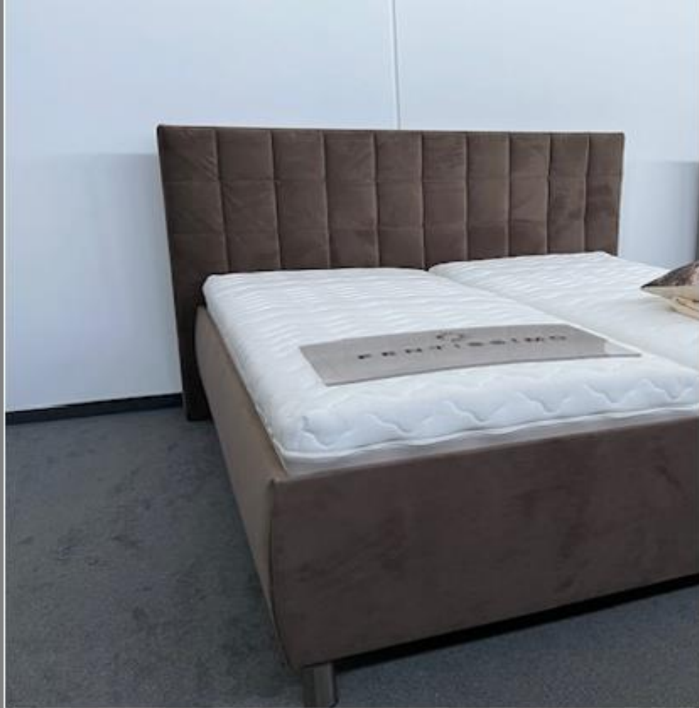
KT TM 17