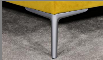
Wing silber matt