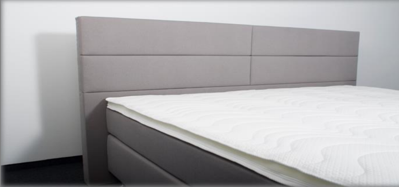
KT Space I