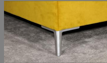
Urban Alu gebürstet