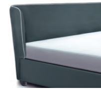
1871 Höhe 107 cm * inkl. Keder