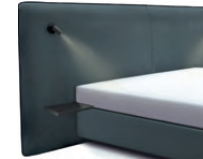
1867 Höhe 129 cm mit 2 Ablagetischen und 2 Lampen schwarz inkl. Keder