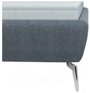
leicht konisch ohne Sichtholzrahmen Höhe ca. 24 cm