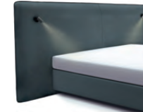
1867 Höhe 129 cm mit 2 Lampen schwarz inkl. Keder