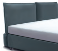
1857 Höhe 106 cm *