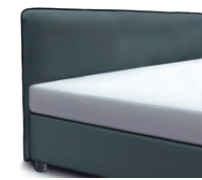
1869 Höhe 116 cm * inkl. Keder