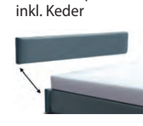
3124 Höhe 24 cm Kopfteil-Blende