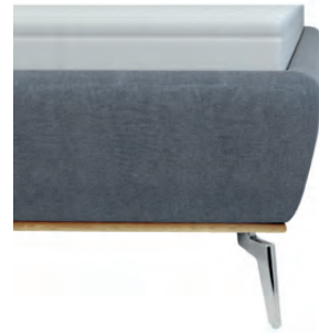
leicht konisch mit Sichtholzrahmen Wildeiche geölt - nur bei Fußhöhe 16 cm lieferbar - Höhe ca. 26 cm inkl. Sichtholzrahmen