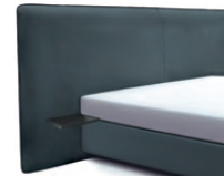
1867 Höhe 129 cm mit 2 Ablagetischen inkl. Keder