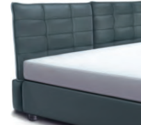
1858 Höhe 106 cm *