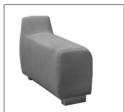
Armlehne „A“ Breite: ca. 30 cm

Die Armlehnen sind nicht zum Sitzen geeignet. Die maximale Belastbarkeit beträgt ca. 25 kg.