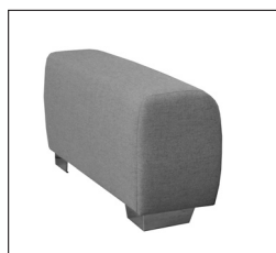
Armlehne „B“ Breite: ca. 30 cm