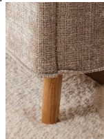
Holzfuß massiv, eichefarbig