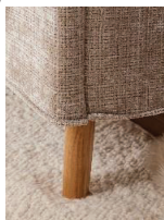
Holzfuß massiv, eichefarbig