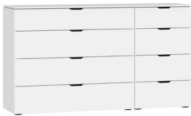
Kommode Typ 13