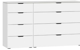
Kommode Typ 12