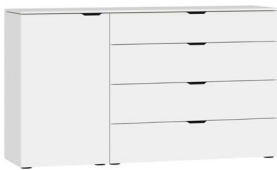
Kommode Typ 15